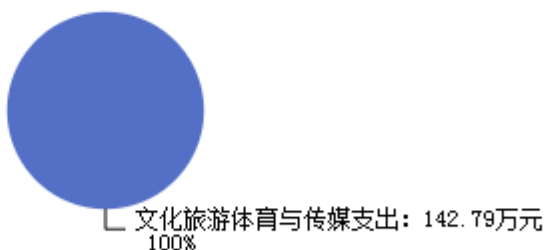
图3：财政拨款支出决算结构图

2024年度一般公共预算财政拨款支出142.79万元，主要用于以下方面：文化旅游体育与传媒（类）支出142.79万元，占100.00%。